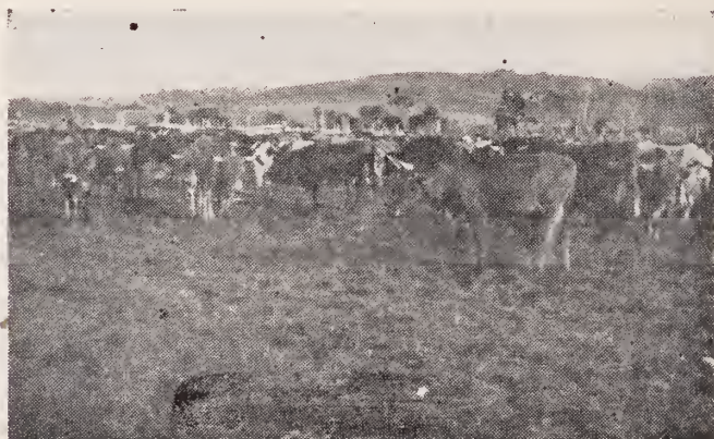
Ganado vacuno en las Misiones de la Gran Sabana.